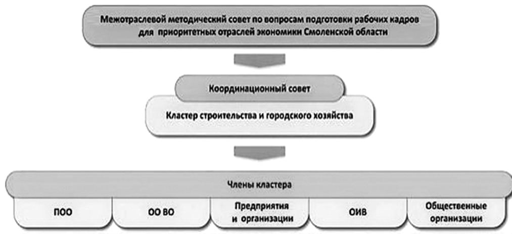
Рис. 2. Механизм управления и участники образовательно-производственного кластера строительства и городского хозяйства: ПОО – потенциально-опасный объект; ОО ВО – учебное заведение; ОИВ – органы исполнительной власти