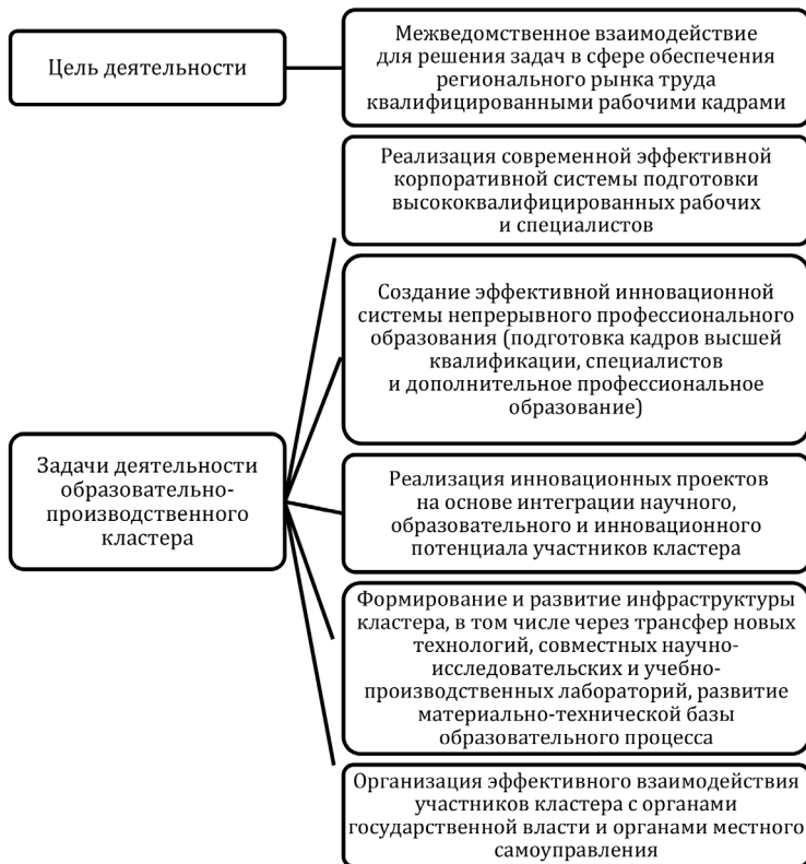
Рис. 1. Цель и задачи деятельности образовательно-производственного кластера строительства и городского хозяйства Смоленской области